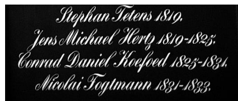
Udsnit af Domkirkens bispetavle